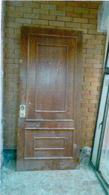
1 PUERTA MADERA 95*2,10 CM